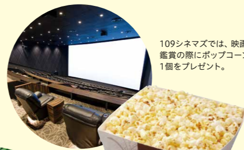
109シネマズでは、映画鑑賞の際にポップコーン1個をプレゼント。