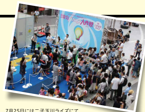
7月25日には二子玉川ライズにて、先着10,000名様に「ガリガリ君」をプレゼント。