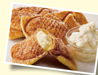
たまプラーザ テラスの「銀のあん」で、冷たいたい焼1匹をプレゼント。