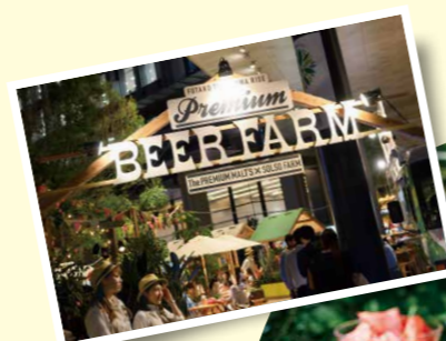
二子玉川ライズでは、夏季限定のビアテラスにて生ビール1杯をプレゼント。